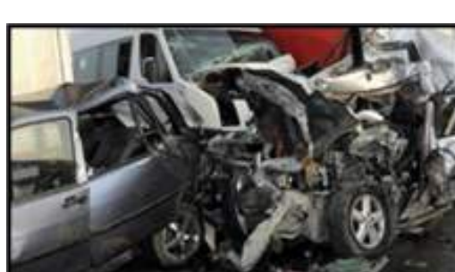
Risque survenu accidents élevé