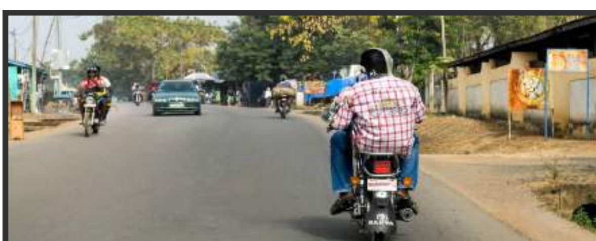
Acuité visuelle & Champ visuel normaux

Université iba der thiam de thiès Unité de formation et de recherche des sciences de la santé N° 206 quartier X èmeThiès BP 404 Thiès Site Web : www.uidt.sn